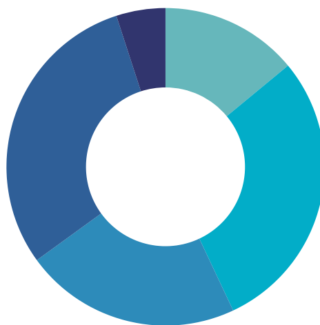
Distribution des charges 180 000$